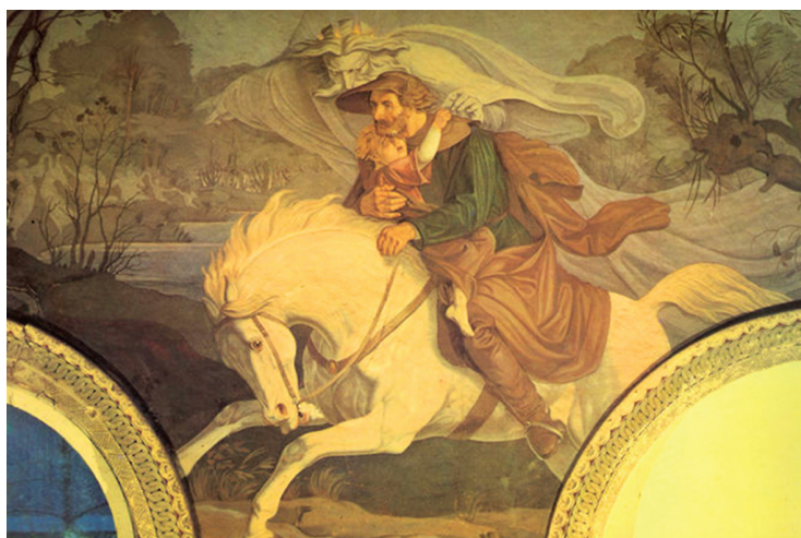
К. Г. Пешель. Лесной царь

«Родимый, лесной царь со мной говорит: Он золото, перлы и радость сулит». «О нет, мой младенец, ослышался ты: То ветер, проснувшись, колыхнул листы». «Ко мне, мой младенец; в дуброве моей Узнаешь прекрасных моих дочерей: При месяце будут играть и летать, Играя, летая, тебя усыплять». «Родимый, лесной царь созвал дочерей: Мне, вижу, кивают из тёмных ветвей». «О нет, всё спокойно в ночной глубине: То ветлы седые стоят в стороне». «Дитя, я пленился твоей красотой: Неволей иль волей, а будешь ты мой». «Родимый, лесной царь нас хочет догнать; Уж вот он: мне душно, мне тяжело дышать». Ездок оробелый не скачет, летит; Младенец тоскует, младенец кричит; Ездок погоняет, ездок доскакал... В руках его мёртвый младенец лежал.