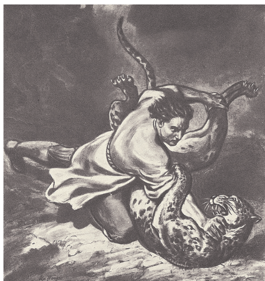
И. М. Тоидзе. Бой с барсом

Зажглося жаждою борьбы И крови... да, рука судьбы Меня вела иным путём... Но нынче я уверен в том, Что быть бы мог в краю отцов Не из последних удальцов.