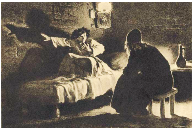
О. Л. Пастернак. Чернец и монах

Он на допрос не отвечал, И с каждым днём приметно вял; И близок стал его конец. Тогда пришёл к нему чернец 1 С увещеваньем и мольбой; И гордо выслушав, больной Привстал, собрав остаток сил, И долго так он говорил: