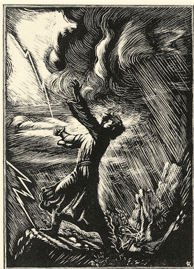
Д. Ф. Константинов. Мцыри в грозу

Ты хочешь знать, что делал я На воле? Жил — и жизнь моя Без этих трёх блаженных дней Была б печальней и мрачней Бессильной старости твоей.